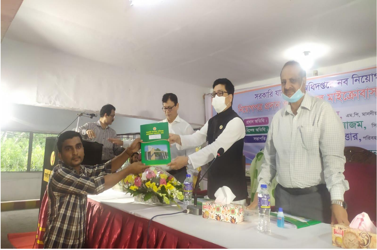
নব নিয়োগপ্রাপ্ত কর্মচারীদের নিয়োগপত্র বিতরণ।