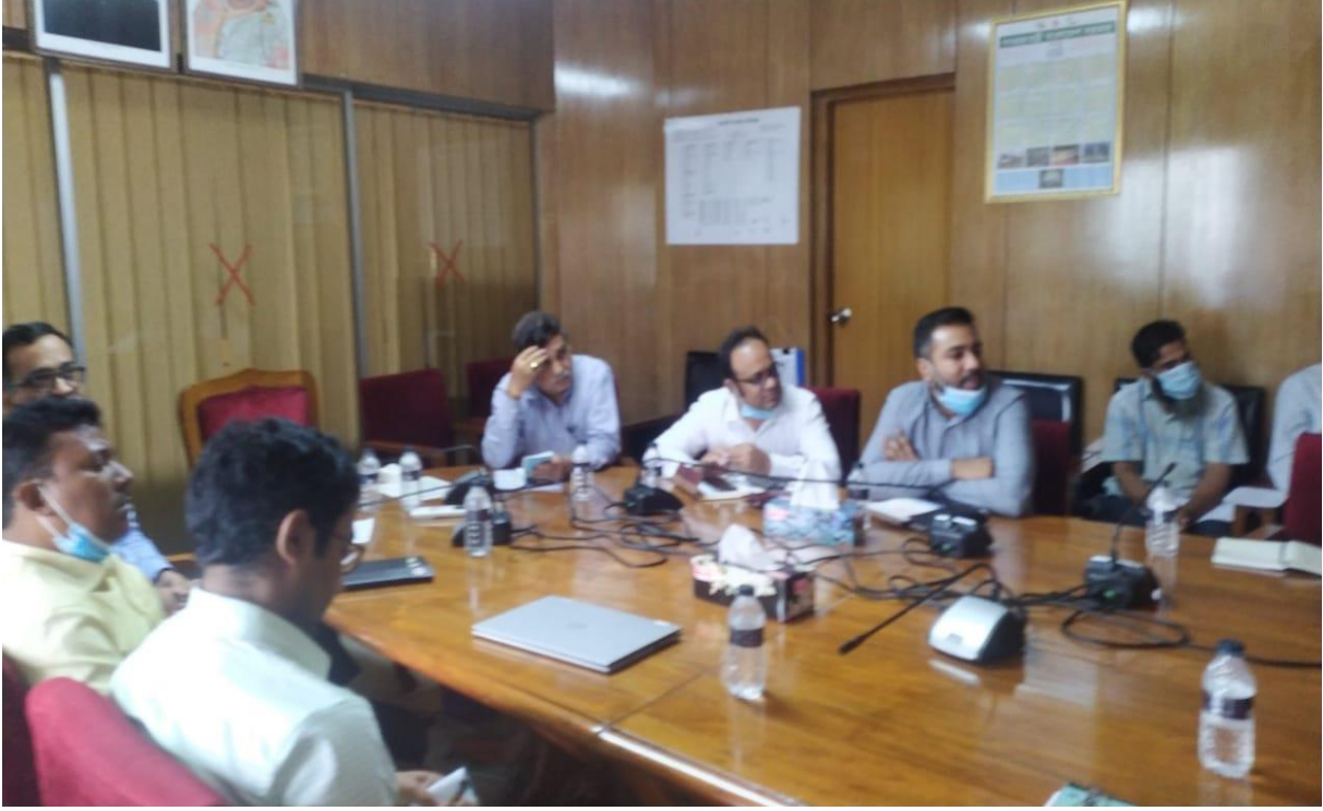
আইসিটি-র প্রতিনিধিসহ অফিস অটোমেশন সংক্রান্ত সভা।