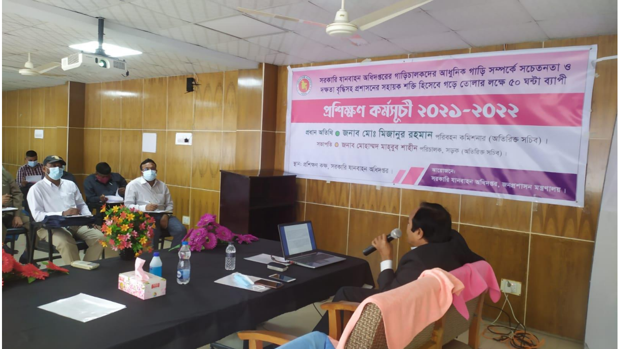
গাড়িচালকদের আধুনিক গাড়ি সম্পর্কে সচেতনতা ও দক্ষতা বৃদ্ধিসহ প্রশাসনের সহায়ক শক্তি হিসেবে গড়ে তোলার জন্য ৫০ঘন্টা ব্যাপী প্রশিক্ষণ কর্মসূচী।