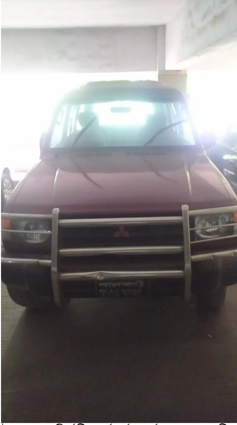
উপজেলা নির্বাহী কর্মকর্তা কর্তৃক ব্যবহৃত জীপ।