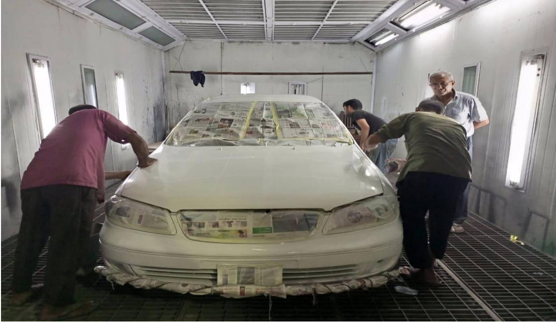
সরকারি যানবাহন মেরামত কারখানায় একটি কারের ডেন্ট-পেন্ট কাজ