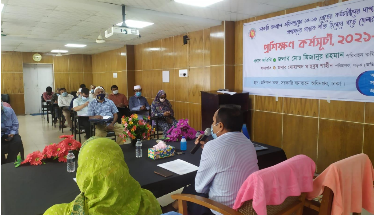
সরকারি যানবাহন অধিদপ্তরের ১০-১৬ গ্রেডের কর্মচারীদের ৭দিন ব্যাপী প্রশিক্ষণ কর্মসূচী।