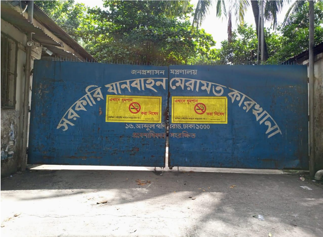
সরকারি যানবাহন মেরামত কারখানা প্রধান ফটক।