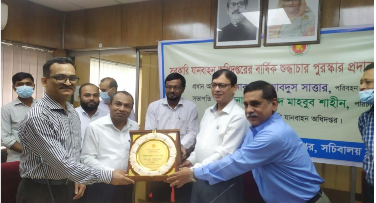
সরকারি যানবাহন অধিদপ্তরের বার্ষিক শুদ্ধাচার পুরস্কার প্রদান।