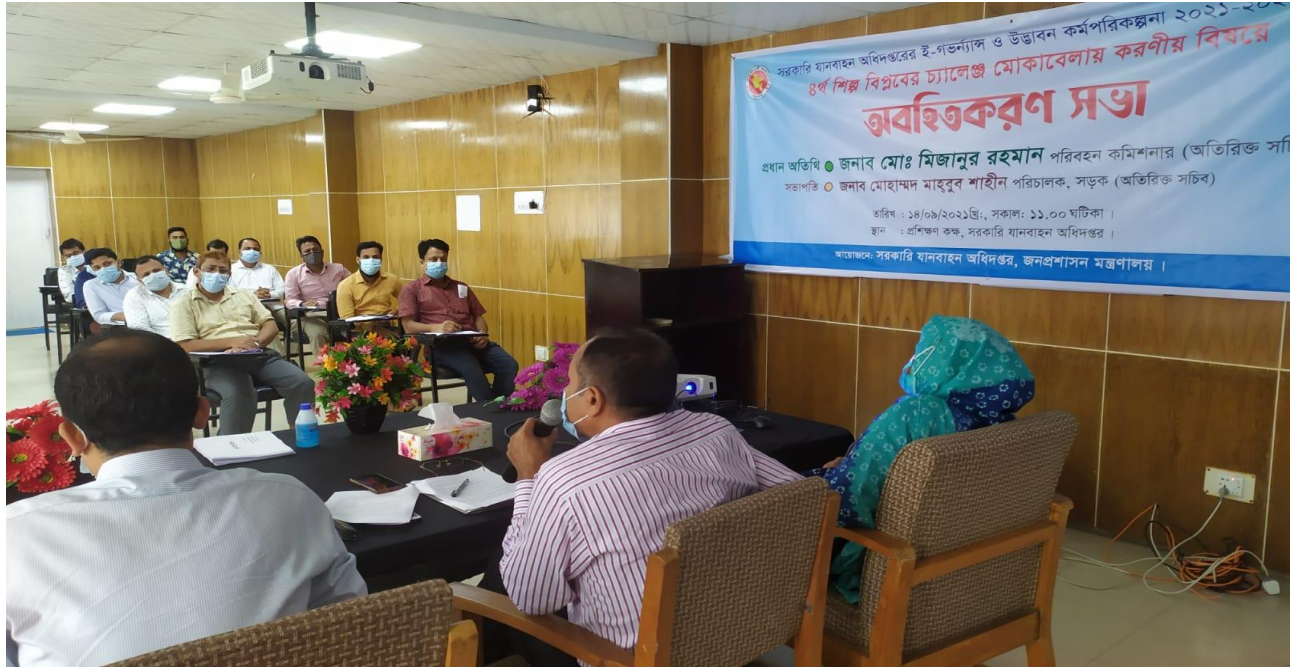
সরকারি যানবাহন অধিদপ্তরের ই-গভর্ন্যান্স ও উদ্ভাবন কর্মপরিকল্পনা ২০২১-২২, ৪র্থ শিল্প বিপ্লবের চ্যালেঞ্জ মোকাবেলায় করণীয় বিষয়ে অবহিতকরণ সভা।