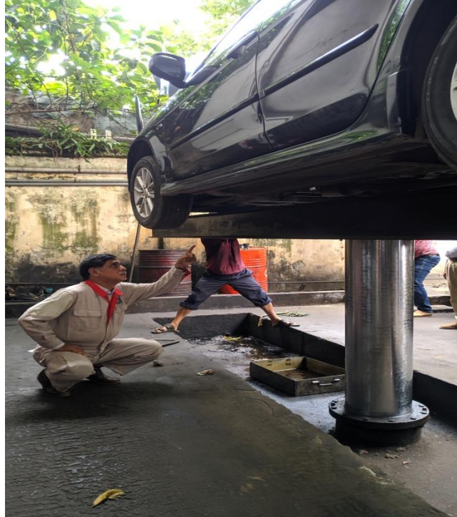
পরিচালক (সড়ক) কর্তৃক গাড়ি সার্ভিসিং পরিদর্শনা