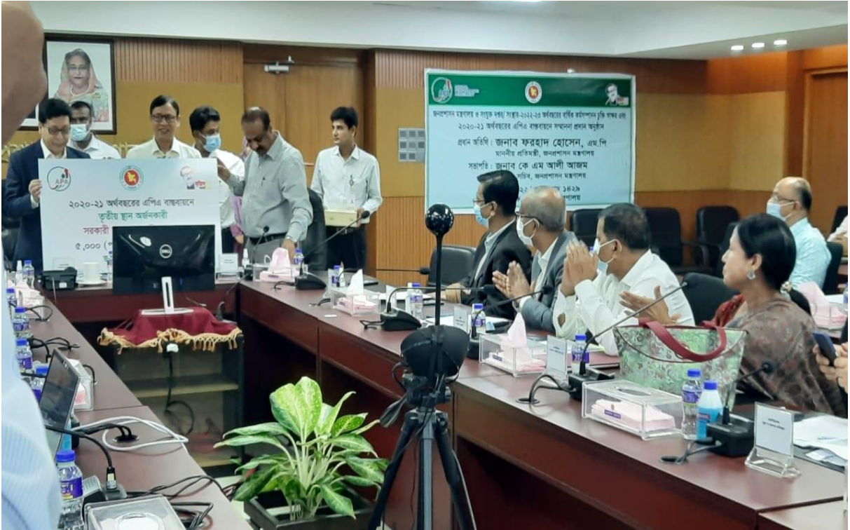
বার্ষিক কর্মসম্পাদন চুক্তি ২০২১-২০২২ তৃতীয় স্থান অর্জন পুরস্কার।