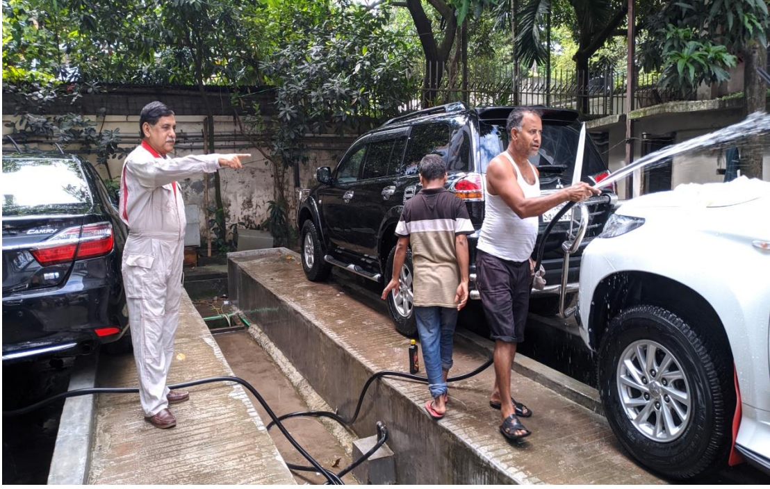
পরিচালক (সড়ক) কর্তৃক গাড়ি পরিষ্কার পরিদর্শনা