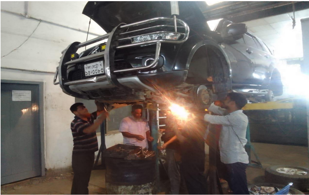
সরকারি যানবাহন মেরামত কারখানায় একটি জীপগাড়িতে ব্রেক ও সাসপেনশনের কাজ