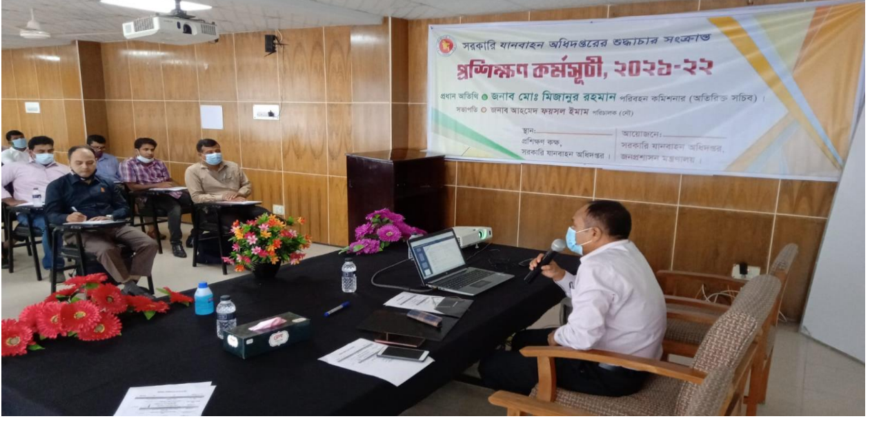
সরকারি যানবাহন অধিদপ্তরের শুদ্ধাচার সংক্রান্ত প্রশিক্ষণ