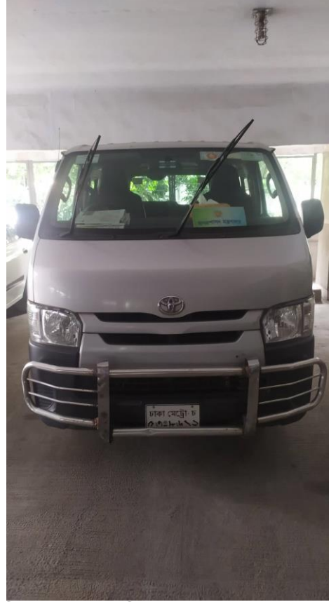
বিভিন্ন মন্ত্রণালয়, বিভাগ ও জেলা পুনে ব্যবহৃত মাইক্রোবাস।