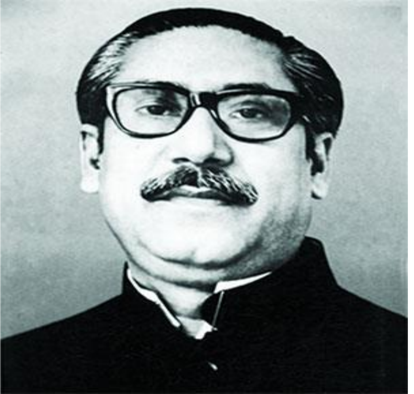
জাতির পিতা বঙ্গবন্ধু শেখ মুজিবুর রহমান