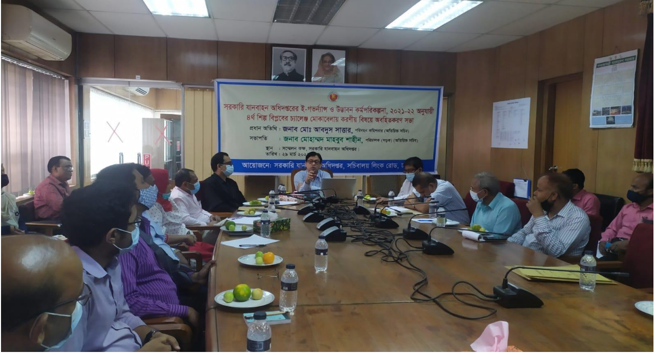
সরকারি যানবাহন অধিদপ্তরের ই-গভর্ন্যান্স ও উদ্ভাবন কর্মপরিকল্পনা ২০২১-২২, ৪র্থ শিল্প বিপ্লবের চ্যালেঞ্জ মোকাবেলায় করণীয় বিষয়ে অবহিতকরণ সভা।