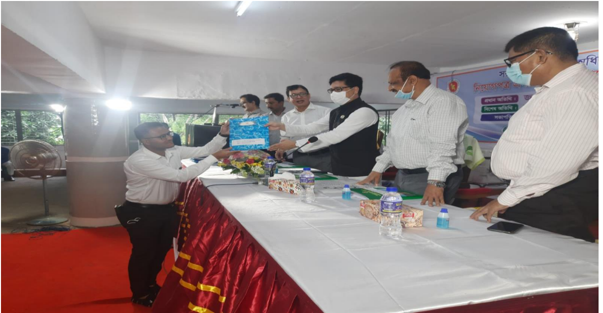
বিভিন্ন জেলাপুলে নতুন মাইক্রোবাস হস্তান্তর।