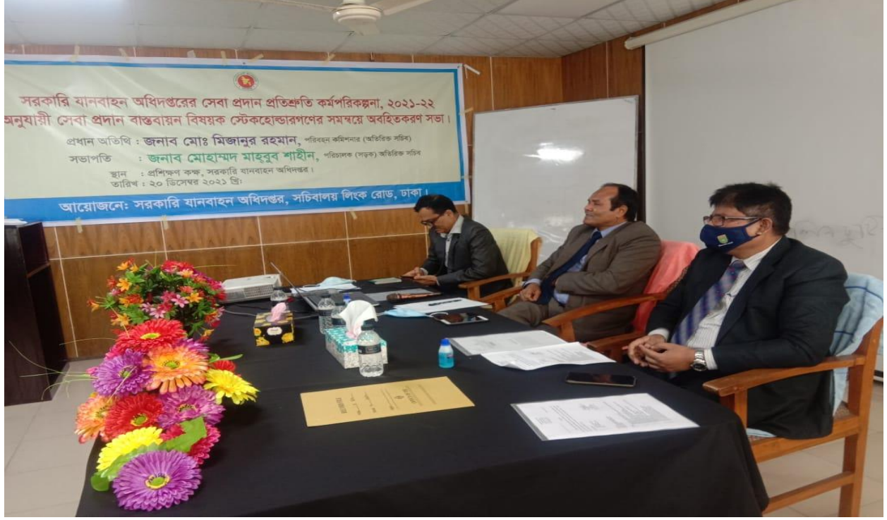
সরকারি যানবাহন অধিদপ্তরের সেবা প্রদান প্রতিশ্রুতি কর্মপরিকল্পনা ২০২১-২২ অনুযায়ী সেবা প্রদান বাস্তবায়ন বিষয়ক স্টেক হোল্ডারগণের সমন্বয়ে অবহিতকরণ সভা।