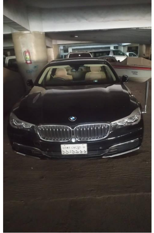
মাননীয় মন্ত্রী/প্রতিমন্ত্রী মহোদয়গণের ব্যবহারের জন্য হাইব্রিড কারা