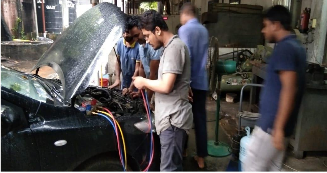
সরকারি যানবাহন মেরামত কারখানায় একটি জীপগাড়িতে এসির মেরামত কাজ