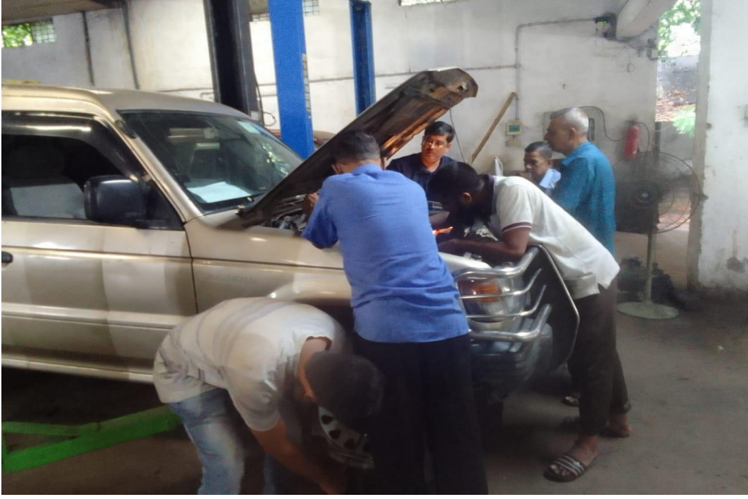
সরকারি যানবাহন মেরামত কারখানায় একটি জীপগাড়িতে ইঞ্জিন মেরামত কাজ