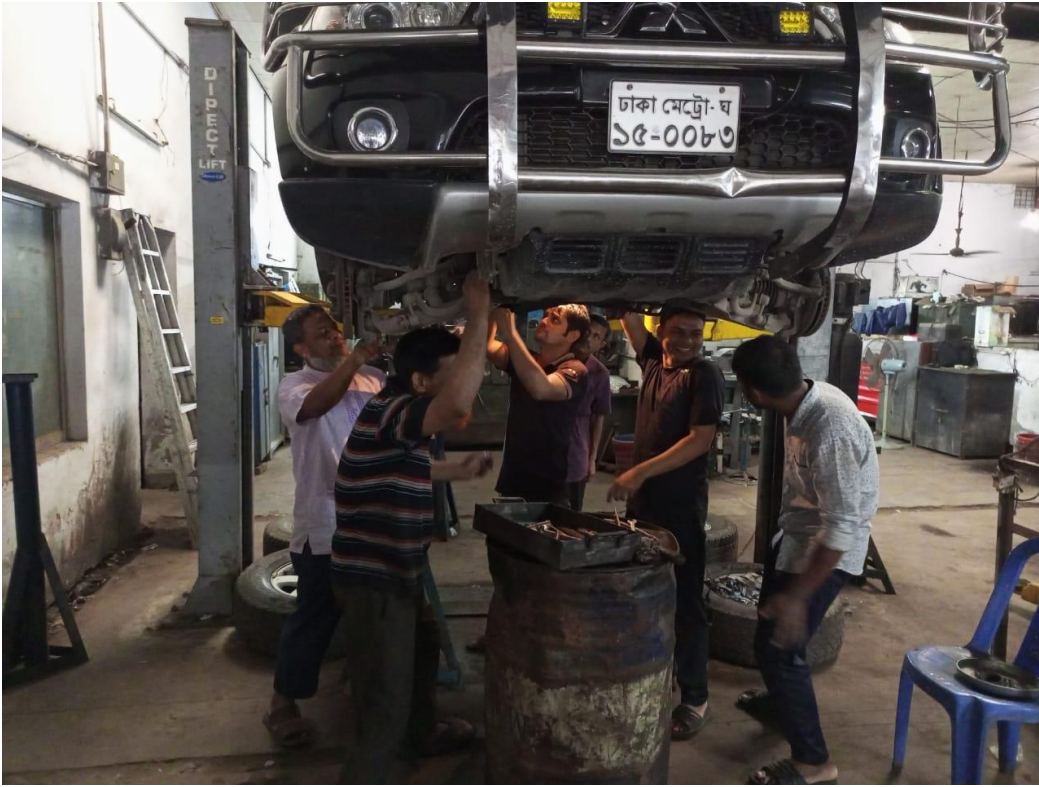
সরকারি যানবাহন মেরামত কারখানায় একটি জীপগাড়িতে ব্রেক ও সাসপেনশনের কাজ